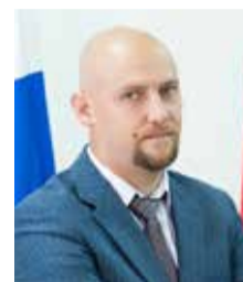
МИНИСТР ЭНЕРГЕТИКИ МОСКОВСКОЙ ОБЛАСТИ Л.В. НЕГАНОВ

Сердечно поздравляю коллектив «Мособлэнерго» с десятилетием компании! Работая в постоянном контакте с компанией, не раз убеждался в способности коллектива оперативно и эффективно решать как текущие, так и перспективные задачи по надежному энергообеспечению региона. Это стало возможным, благодаря умелой организации производства, внедрению прогрессивных технологий и новой техники, совершенствованию процесса технологического присоединения к электросетям. Сегодня компания стала полигоном для обкатки новшеств, для перехода на международные стандарты качества и надежности энергоснабжения. Очень важно, что, постоянно расширяя сферу своей деятельности за счет консолидации электросетевых активов Подмосковья, «Мособлэнерго» способствует внедрению всего передового в свои филиалы. Желаю коллективу успехов на этом пути!