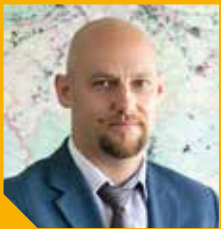
ЛЕОНИД НЕГАНОВ, Министр энергетики Московской области:

Со дня окончания Великой войны прошло семьдесят лет. Быстро пролетело время, и даже самые юные ее участники превратились в убежденных сединами ветеранов. Удивительный праздник, пожалуй, единственный, в котором сочетаются горе и радость, слезы и улыбки, печаль и веселье.