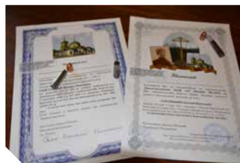
Гильза-медальон с данными погибшего воина и именная благодарность за пожертвование